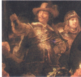
Schutters uit de Nachtwacht

Het liet zich gaarne als groep portretteren in zgn. 'Schutterstukken' (zoals bijv. de 'Nachtwacht' van Rembrandt van Rijn). En het vernoemde zich bij voorkeur naar de meer militante types onder de schutspatronen.