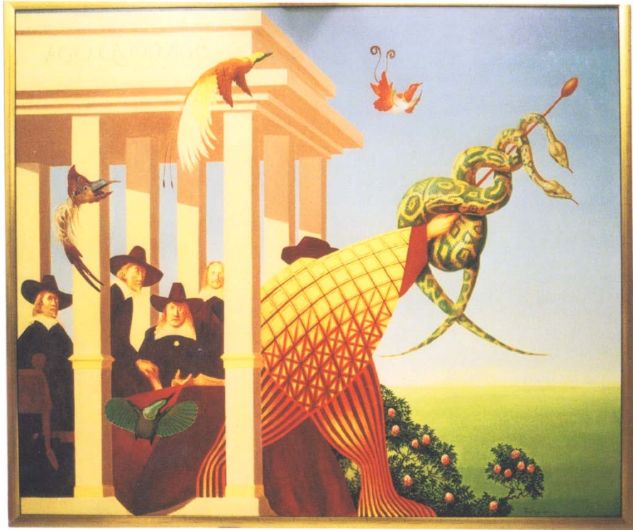
Sint Joris, olieverf, 200 x 160

- Liefde voor het goede en het schone , in algemene zin aangeduid door rozenstruiken en