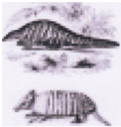
Schub- en gordeldier

Dit wezen is omringd (zoals te doen gebruikelijk) door onschuldige, doch onnozele schepsels