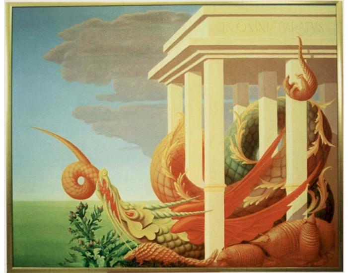
Staalbankiers The Hague